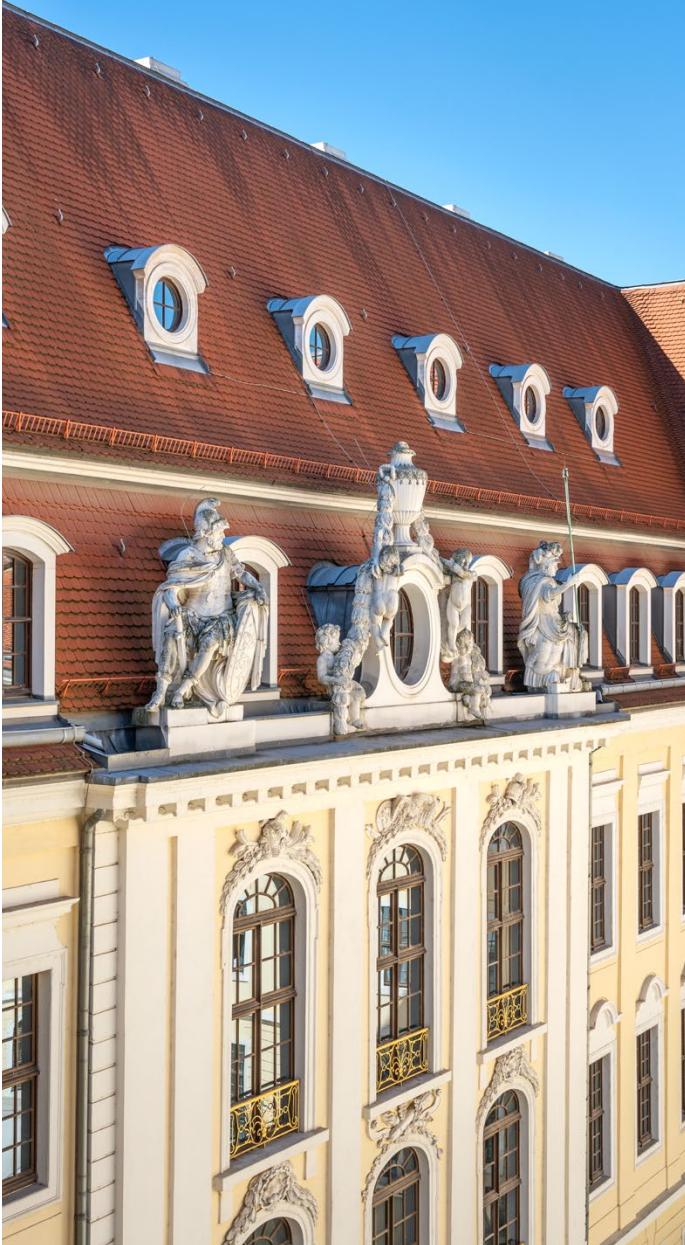
HISTORISCHE FASSADE DES INNENHOFS