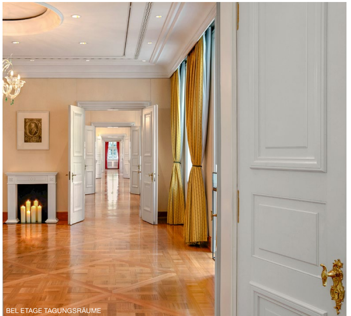
BEL ETAGE TAGUNGSRÄUME