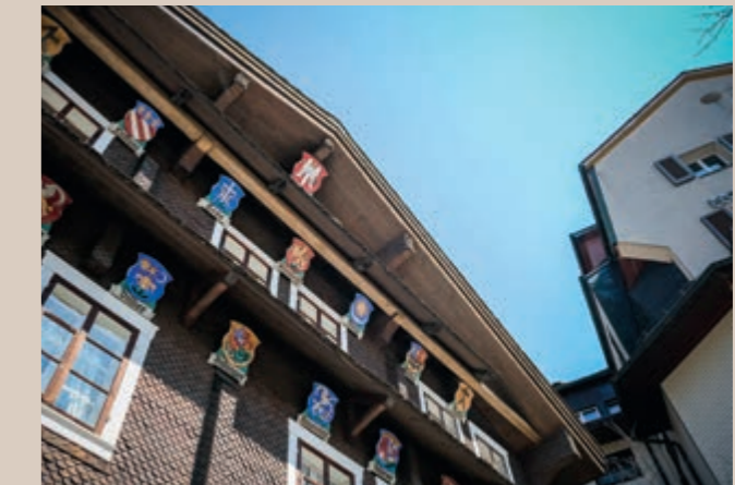
Talmuseum Kloster The Hall