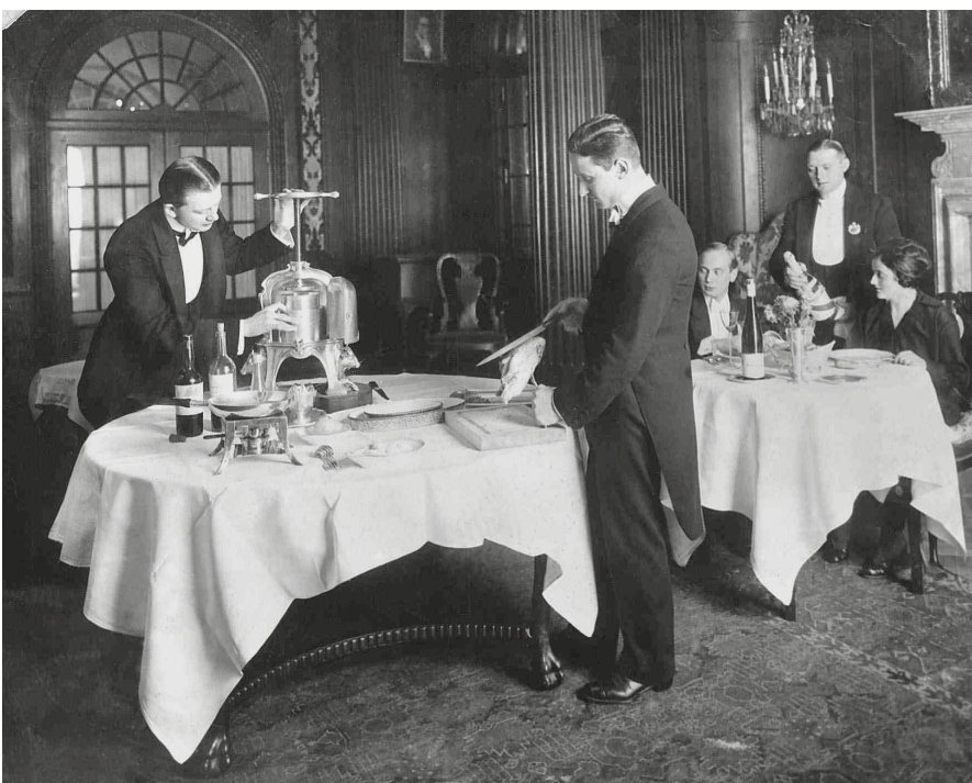
Service bei der Zubereitung der Sauce für den berühmten "Canard à la presse"

1964 - wird der Seitenflügel renoviert und bis 1970 als Hotel in der DDR weitergeführt 1984 - entscheidet das Politbüro der SED die Sprengung des Seitenflügels Am 23. August 1997 als Teil von Kempinski wiederöffnet Spiegelt heute den klassischen Stil seines historischen Vorbilds wider