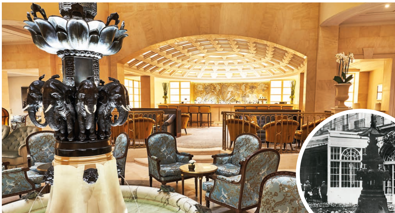
Elefantenbrunnen im Goethegarten um 1930