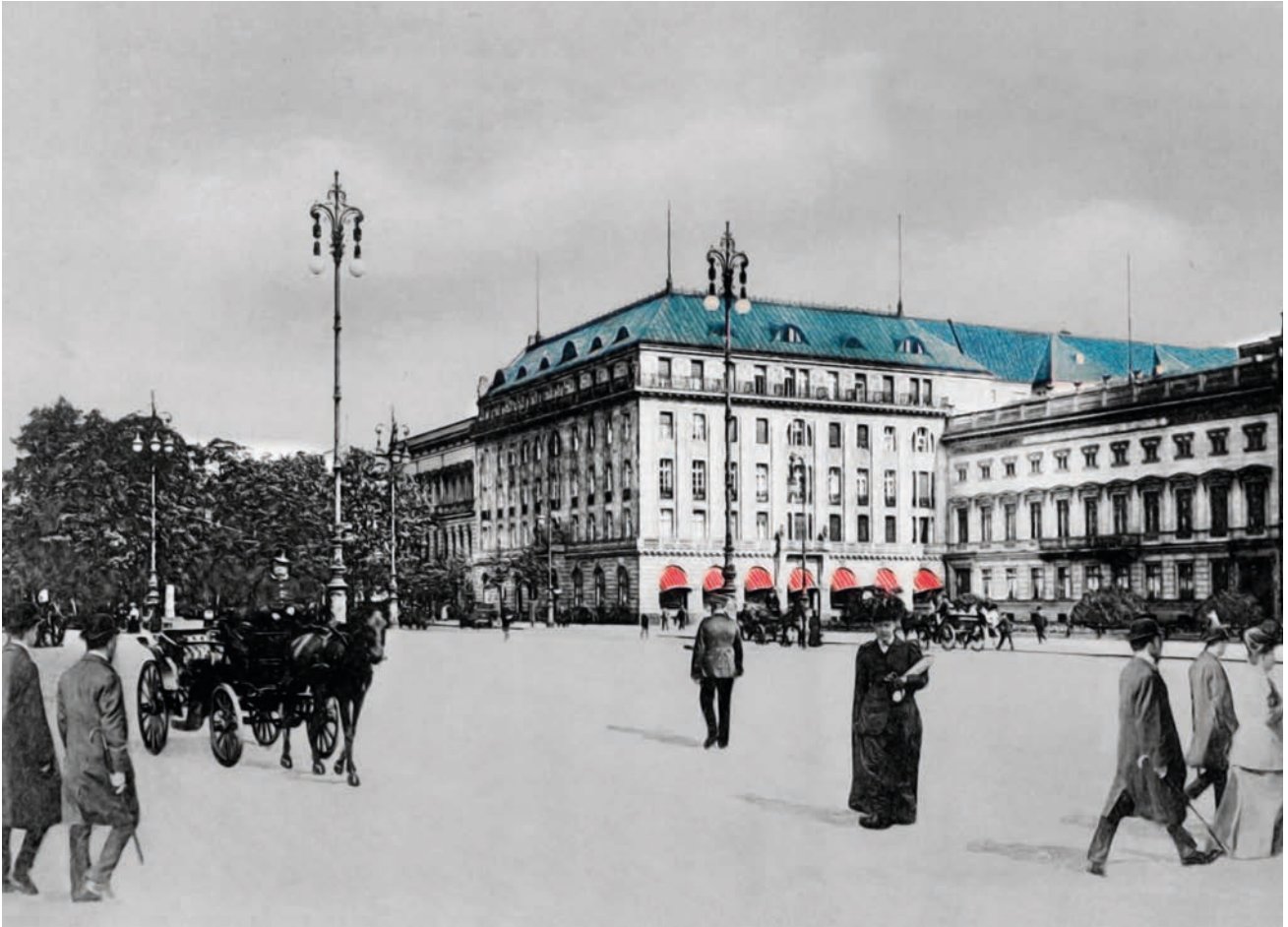
Hotel Adlon, 1926